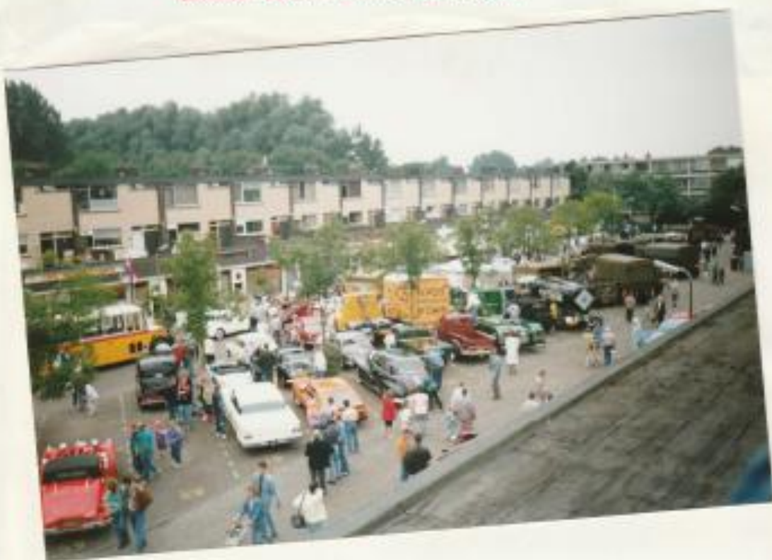
Vervoer 19..toen Willem Ruijsplein