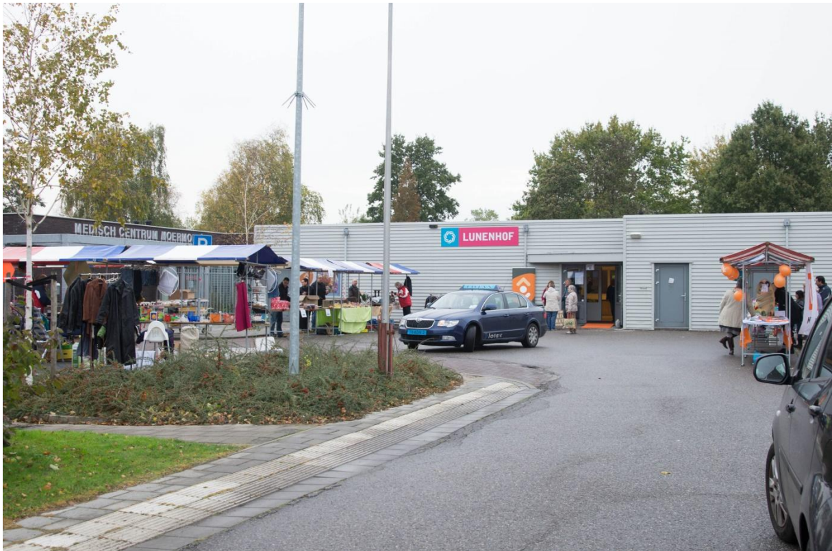
Activiteiten tijdens de opening september 2012.