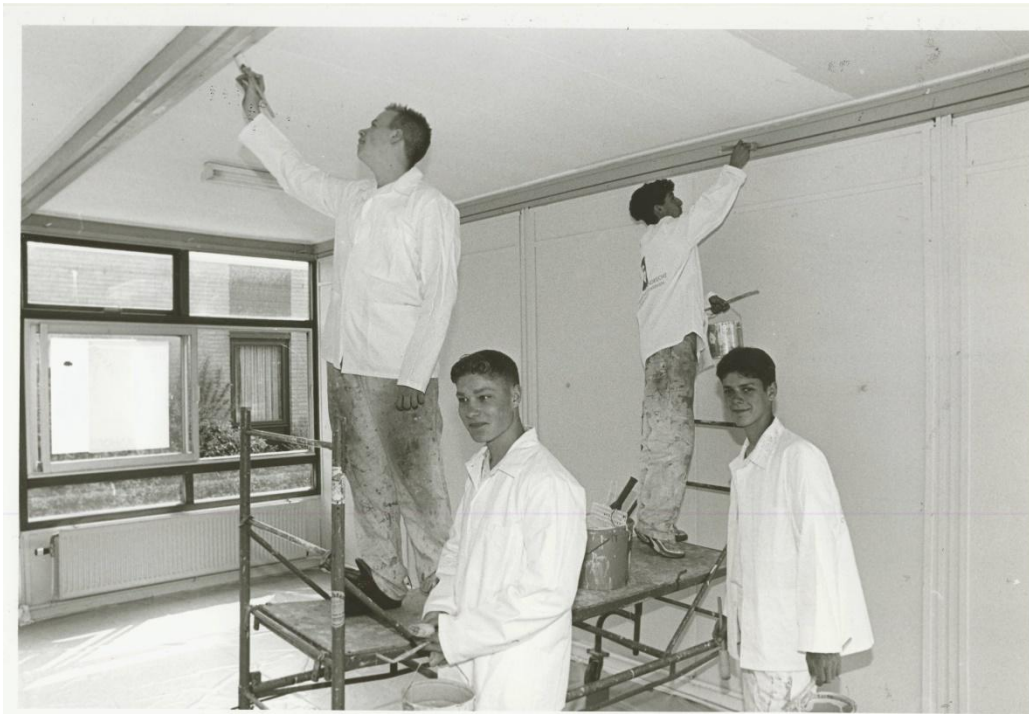
Leerlingen van de LTS schilderen de Lunenhof.

Eind 1992 komt een gedeelte van het gebouw van “de Nesse” vrij. De ruimte kan een dubbelfunctie krijgen: ontmoetingsruimte voor de stichting en als ruimte voor de Oecumenische Gemeenschap. Op 5 januari 1993 besluit het college van B&W dat de gehele ruimte ter beschikking gesteld wordt aan de stichting.