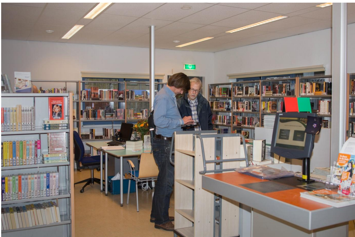
Steunpunt bibliotheek van A tot Z in de Lunenhof.