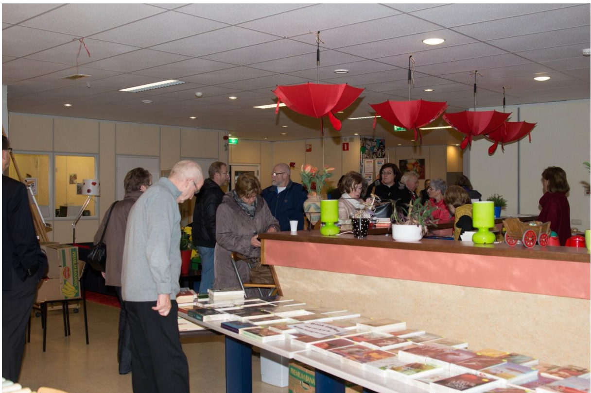
Iedere eerste zaterdag van de maand is er boekenmarkt in de Lunenhof.