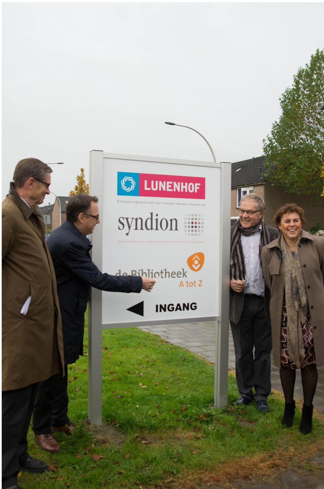
Opening, september 2012