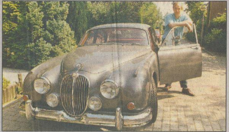
De Dordtenaar 12 juni 1993

Op pagina 16: Tientallen pronkstukken op rit voor de Lunenhof